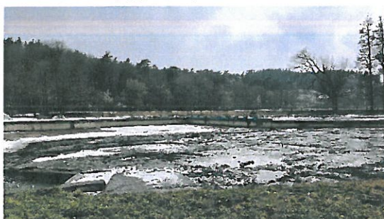
(zdjęcie nr 5)