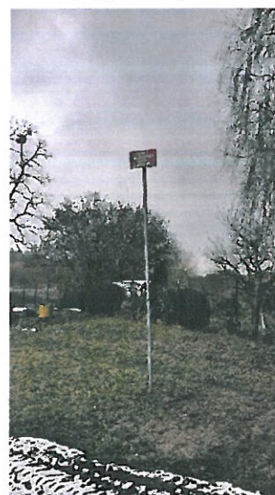
(zdjęcie nr 4)