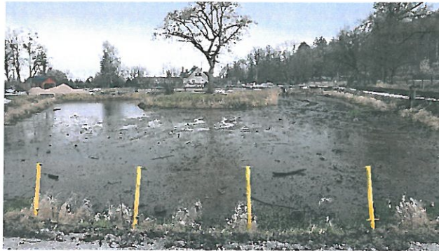
(zdjęcie nr 7)

Od 2022 roku trwa realizacja w tym miejscu projektu pn.: „Rewitalizacja terenu rekreacyjnego „Basen” w Starym Kurowie”. Projekt nie zawiera czynności związanych z przystosowaniem zbiornika do kąpieli,