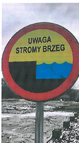
(zdjęcie nr 3)