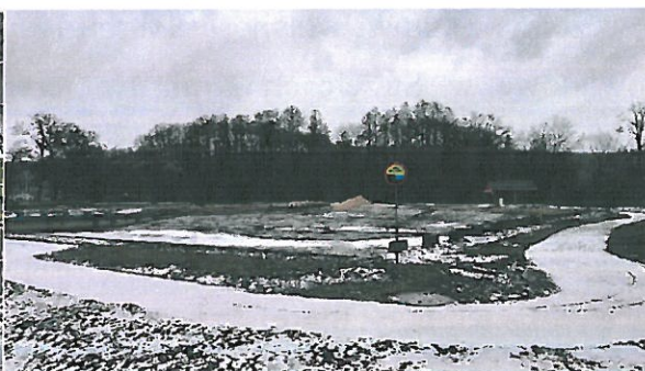
(zdjęcie nr 2)