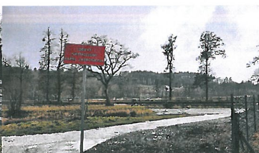
(zdjęcie nr 6)