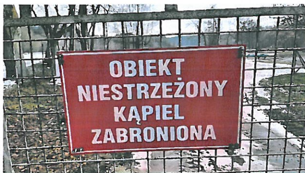
(zdjęcie nr 1)

wodnej zamknięte z zakazem kąpieli. Na tym samym, ogrodzonym obszarze znajduje się zbiornik zwyczajowo zwany „podkową” - z uwagi na kształt (zdjęcie nr 7), ma on powierzchnię 1.817 m 2 . Wskazane zbiorniki nie są wykorzystywane przez mieszkańców jako kąpielisko. Na bramie od strony północnej znajduje się tablica informująca o zakazie kąpieli (zdjęcie nr 1). Kolejna tablica o tej samej treści znajduje się w środkowej części obiektu (zdjęcie nr 4). Kolejna jest umieszczona przy bramie od strony południowo-wschodniej, a tzw. „podkową” (zdjęcie nr 6). Nadto przy krawędzi basenu znajduje się znak informujący o stromym brzegu (zdjęcia nr 2 i 3).